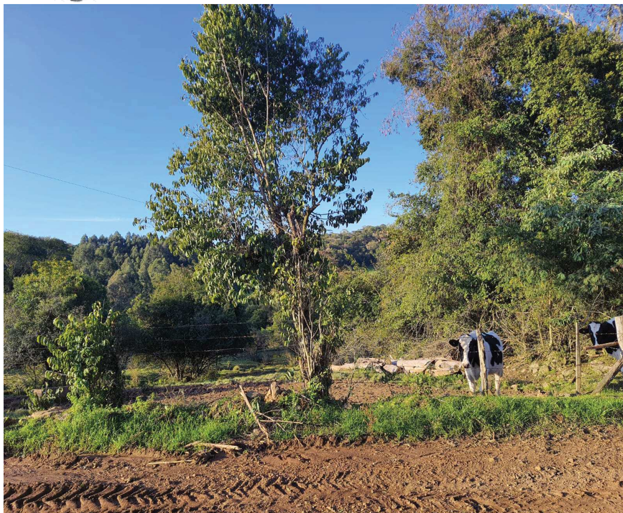
Potreiro entre as árvores

ESTADO DO RIO GRANDE DO SUL PODER JUDICIÁRIO